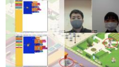
ITで解決したい社会の課題を整理して、実際にしくみをつくらう