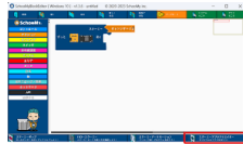
「スクーミーアプリクリエーター」 ® でアプリ開発スキルを身につけよう