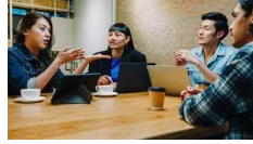
あなたの関心があることは？ 社会で活躍する人に話を聞いてみよう