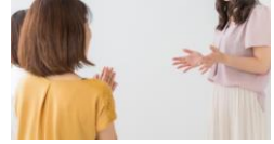
発表会で成果を報告しよう!